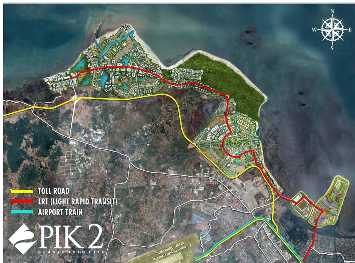
Gambar 2: Rencana “PIK 2 expansion” di pantai utara Tangerang sampai muara sungai Cisadane di sebelah barat (kiri atas). Kanan bawah adalah pulau-pulau reklamasi di lepas pantai Jakarta (Sumber: PIK 2 - Sedayu Indo City).

nelayan dalam lalu-lintasnya menuju dan pulang dari lokasi penangkapan ikan, pangkalan pendaratan, dan