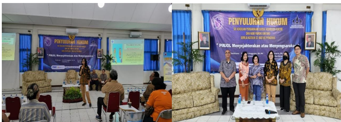
Gambar 2: Kegiatan Penyuluhan